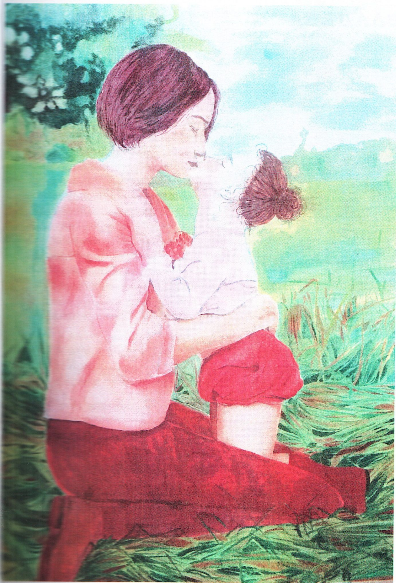
Г. Сальвинский. Автор Даша Каминская